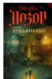
Обложка первого издания книги С. Лукьяненко «Дозор»