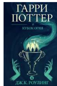
Обложка книги Д. Роулинг «Гарри Поттер»

Представители: Д. Роулинг «Гарри Поттер», М. Петросян «Дом, в котором...», М. Фрай «Сказки старого Вильнюса»