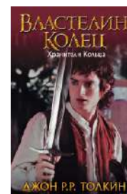
Кинообложка книги Д.Р.Толкиена «Властелин колец»

Говоря о фэнтези, нельзя не упомянуть известнейший ее поджанр – любовно-фантастический роман (ЛФР). Действие в нем происходит в каком-то выдуманном мире, при этом автор акцентирует внимание читателей на романтические отношения между героями. Многие недооценивают этот жанр. Высказываются мнения, что для него характерно низкопробное чтение. И это несправедливо, на мой взгляд. ЛФР популярен среди читателей, книг в таком стиле написано достаточно много, и найти хорошее произведение вполне возможно. Нужно просто знать, где искать.