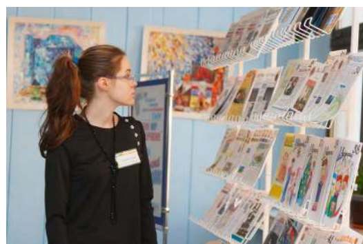
На стенде «Газетный вернисаж».